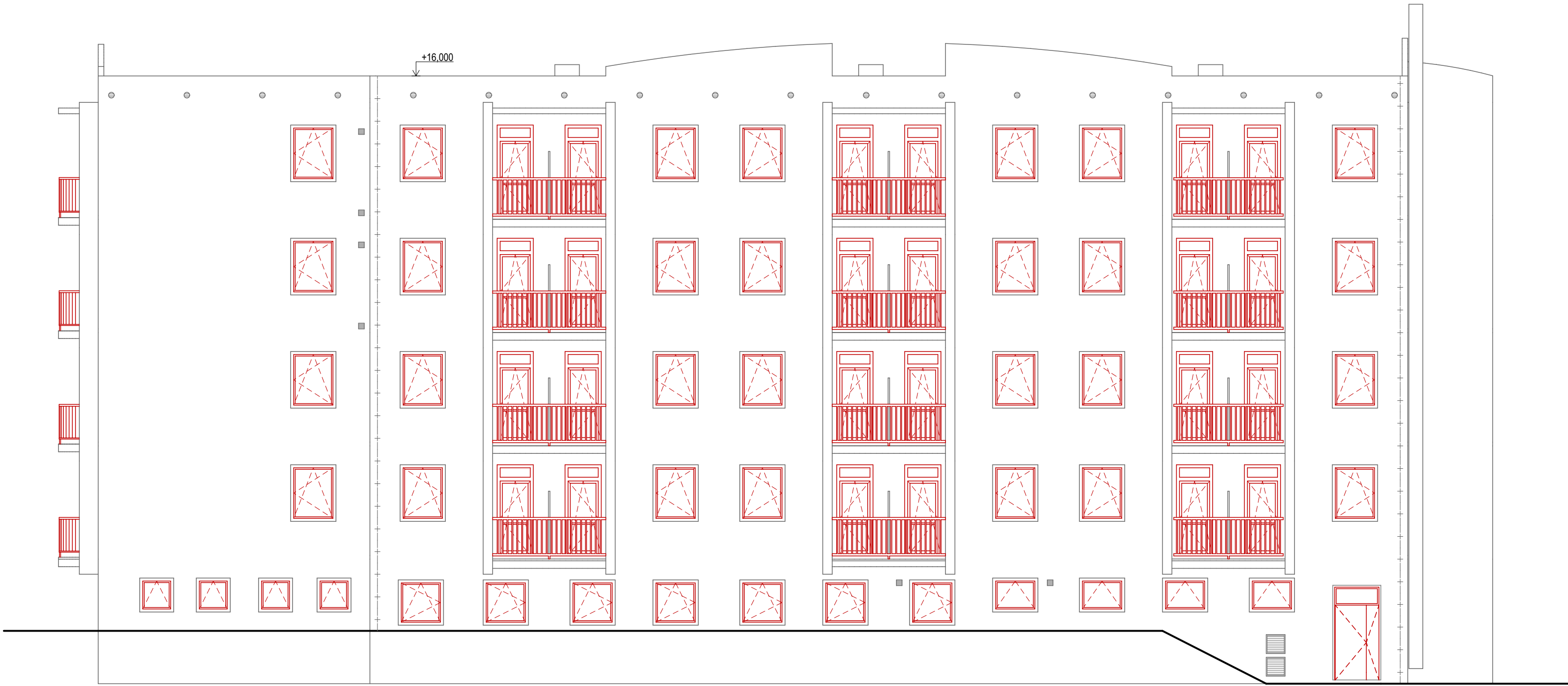
POHLED JIHOVÝCHODNÍ M1:100