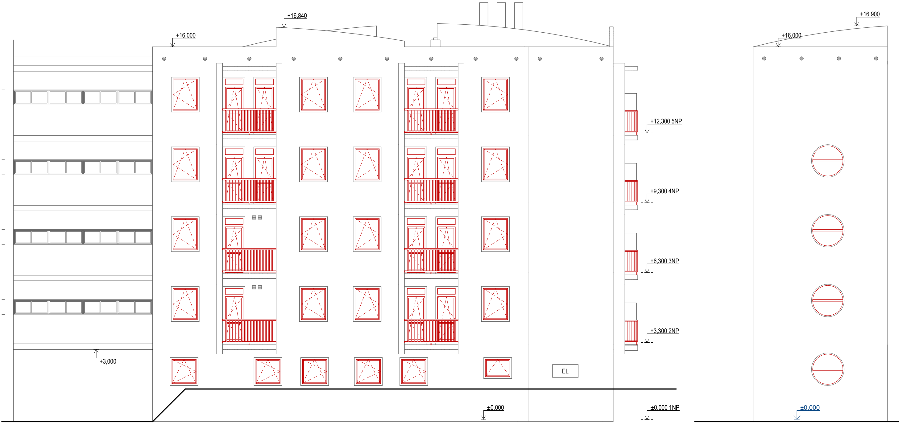
POHLED JIHOZÁPADNÍ M1:100