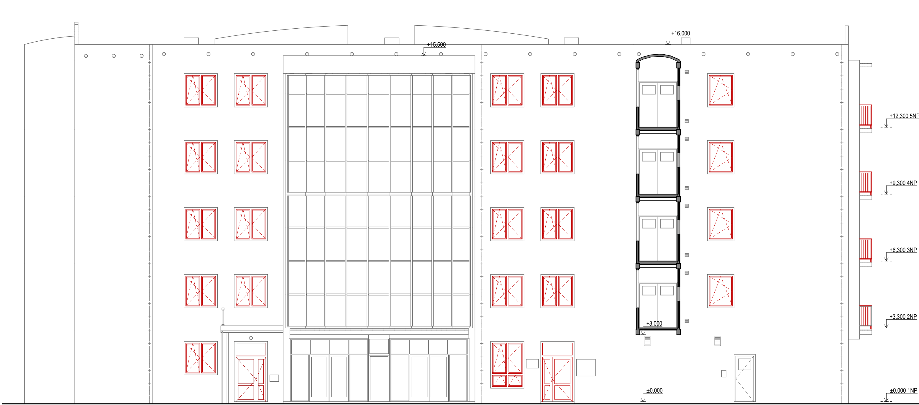
POHLED SEVEROZÁPADNÍ M1:100